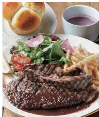
ステーキランチ 1700 Beef Steak Lunch [スープ + ライス or ゆだねパン] 180gの牛肩肉ステーキのボリュームランチ!