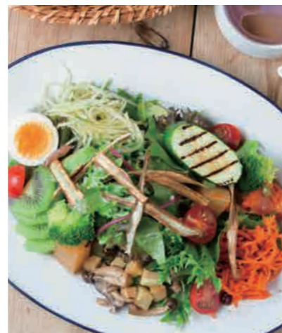
GARBベジプレートランチ 1300 GARB Vegi Plate Lunch [スープ + ゆだねパン] 自家製ドレッシングをお選びいただけます! [オニオン or シーザー or えごま]