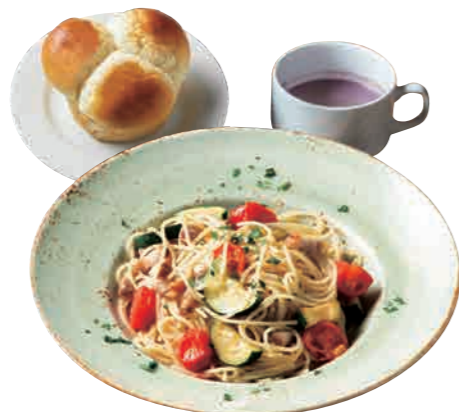
GARB日替わりランチ GARB Daily Lunch [スープ + ライス or ゆだねパン] 1000