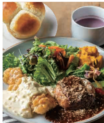
フリットランチ 1400 Fritto Lunch [スープ + ライス or ゆだねパン] 名物ポルチーニのクリームコロッケと フリットもう一種の贅沢ボリュームランチ!