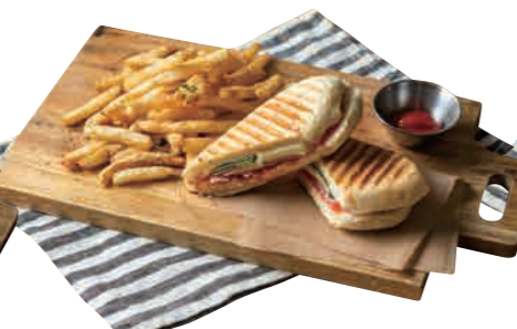
ハムとトマトモッツアレラのホットサンド 1100 Ham, Tomato, Mozzarella & Basil Hot Sandwich [スープ付] イタリア定番の食材、間違いなしの美味しさ。