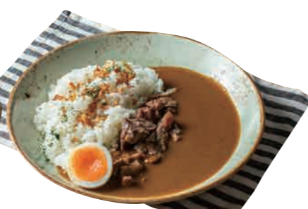
牛すじカレー 850 Beef tendon Curry [スープ付] じっくり煮込んだ牛すじ、定番の欧風カレー!