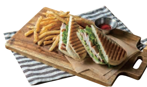
スモークチキンとアボカドのホットサンド 1100 Smoked Chicken & Avocado Hot Sandwich [スープ付] アボカドと燻製したチキンが相性抜群。